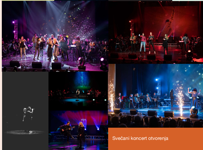
Svečani koncert otvorenja