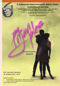
Plakat svečanoga koncerta otvorenja Festivala

Pod Visokim pokroviteljstvom predsjednice Republike Hrvatske Kolinde Grabar-Kitarović, Ministarstva kulture Republike Hrvatske, Županije Brodsko-posavske te Grada Slavanskoga Broda održan je od 19. do 22. studenoga 6. međunarodni festival harmonike Bela pl. Panthy . Na koncertu otvorenja izvedena je glazbeno-scenska adaptacija filma Prljavi ples . Specifičnost programa zahtijevala je i uključivanje članova Plesnoga kluba Aster iz Sarajeva i Športskoga plesnoga kluba Astra iz Slavanskoga Broda. Brodskom harmonikaškom orkestru Bela pl. Panthy pridružio se instrumentalni sastav Trio+2 iz Slavanskoga Broda te su za tu prigodu zajedno nastupili kao Sanja Suarez band .