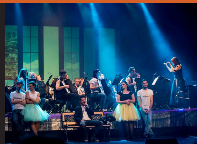
Svečani koncert otvorenja